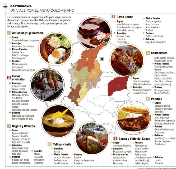
Figura 2: Mapa sobre la gastronomía colombiana.